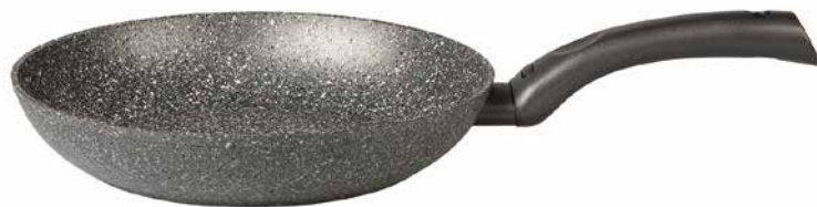
Ø cm 20/8" Ø cm 24/9,5" Ø cm 26/10,5" Ø cm 28/11" Ø cm 30/12" Ø cm 32/12,5" Padella