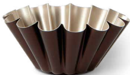
Ø cm 22/9" Stampo budino